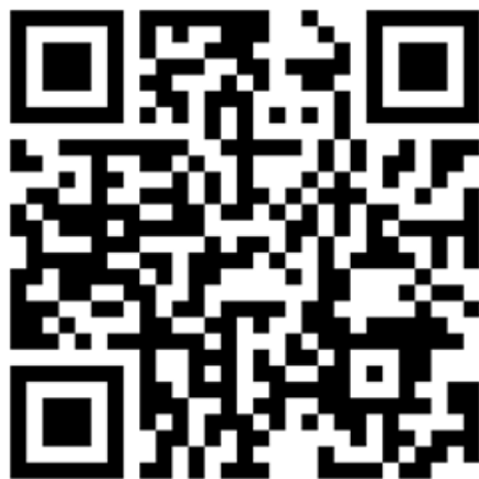
《科技企业投融资需求表》二维码

（一）科技金融精准服务。自 2020 年起，市科技局将精准收集拟申请入库科技型中小企业融资需求（股权、债权），并通过广州市科技型中小企业信贷风险补偿资金池（单个企业最高可申请贷款 2000 万元，操作指引详见附件 4）、广州市科技成果产业化引导基金为入库企业提供科技金融精准对接服务。拟申请入库科技型中小企业可通过微信扫描二维码或登录链接 https://www.wenjuan.com/s/ZneeAzI/ 填写并提交《科技企业投融资需求表》（详见附件 5）。